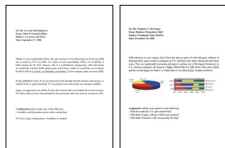
*4 使用eMemo2_BK_A4_20060127, eMemo2_Color_A4_20060127样张测试。

本宣传页中的数据, 来源于爱普生实验室数据, 因使用环境和设置的不同, 与实际使用数据存在差异。