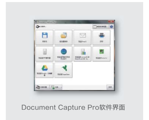
Document Capture Pro软件界面

可以轻松将文档扫描后的数据发至邮件，云端，指定文件夹，即时打印等，让繁杂的文档管理工作变得高效有序。