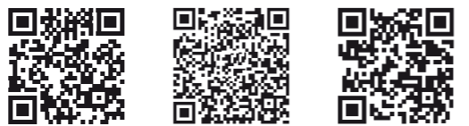
爱普生官方网站 爱普生官方微信 爱普生官方微博

图片仅供参考, 外观以实物为准。本说明若有任何细节之更改, 恕不另行通知。 爱普生 (中国) 有限公司在法律许可的范围内对以上内容有解释权。