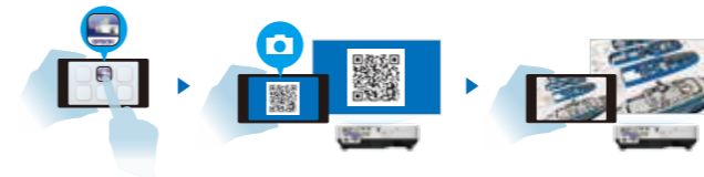
* IOS 系统支持 Word/Excel/PowerPoint/Apple keynote/PDF/JPEG/PNG 文件 Android 系统支持 PDF/JPEG/PNG 文件

“iProjection”可以实现用户将智能设备中文件无线传输，适用于配备网络功能的爱普生投影机，是实现智能投影的高效解决方案。