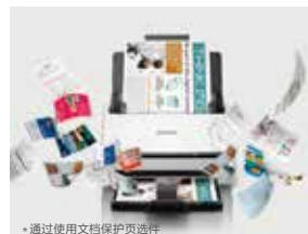
*通过文档保护页选项

使用A4扫描仪也可以扫描A3文件。只需将A3文件进行对折放入A4文档保护页*中进行扫描，扫描仪会识别出文档保护页，并自动将两帧A4图像拼接成一幅完整的A3图像。