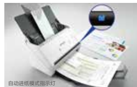
自动进纸模式指示灯

用户在驱动中可选择“自动进纸模式”功能，就能实现无论单次还是多次扫描都可以自动进纸；无需用户再通过扫描驱动或面板发送扫描指令。