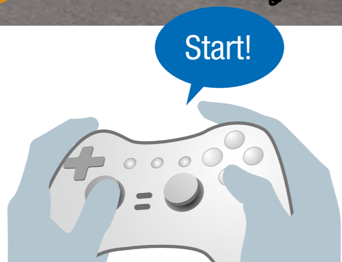
有滞后时间的画面