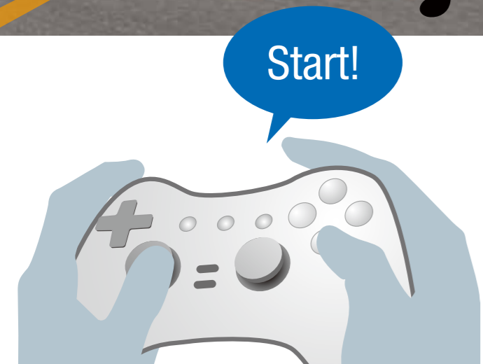
减少滞后时间的画面