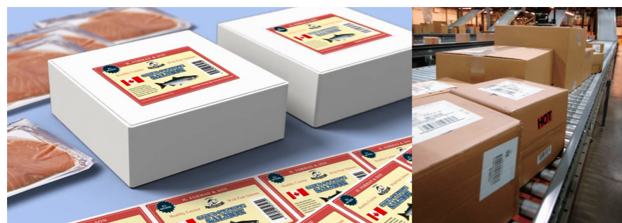
食品 / 生鲜标签 *1