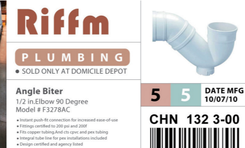
制造业彩色外箱标签