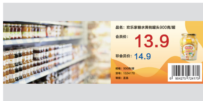
零售行业 彩色价签