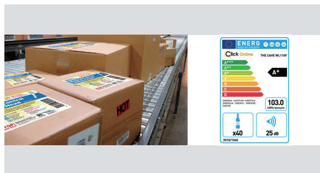
制造行业 能耗标识