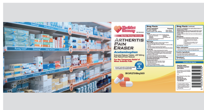
医疗行业 药品/医疗器械标签